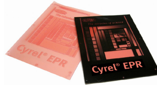
Cyrel® EASY EPR Solvente con Superficie Lisa