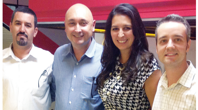
Sociedad de 4 décadas entre DuPont y Fotograv

Para informaciones adicionales acerca de las nuevas planchas Cyrel® EASY visite www.cyrel-la.dupont.com o contacte a su representante de ventas.