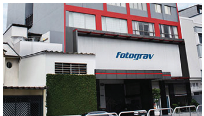
Fachada del edificio donde se encuentra la sede de Fotograv, en el barrio de Barra Funda, en São Paulo

Es de conocimiento del mercado que la formación del punto plano cumple un papel importante en la sustentación del punto formado, garantizando mejor estabilidad en impresión, logrando velocidades superiores en máquina y alcanzando alta calidad. Para esto, sistemas como lo de laminación, inserción de gas inerte y lámparas UV especiales fueron ampliamente difundidos e inclusive Fotograv los utiliza. Complementariamente, fueron desarrollados softwares, lentes y retículas específicas para el incremento de densidad de tinta y mejoría en las altas luces que contribuyeron positivamente en el resultado final de la impresión flexográfica. Esta combinación es tan acertada que incrementa significativamente la productividad del tradeshop y genera ahorros en costos en algunos de estos sistemas.