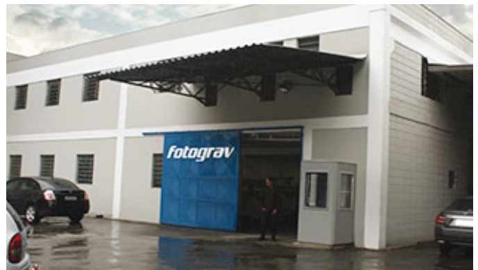
Fotograv Output Center, en Carapicuíba – Grande São Paulo

hacía falta una forma de pre-impresión simplificada, que pudiera mantener o inclusive superar el nivel de calidad que lograban hasta el momento, minimizando el tiempo de proceso y las variables involucradas en la confección de sus planchas.