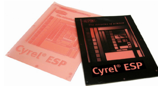
Cyrel® EASY ESP Solvente con Superficie Modificada

Esta nueva plataforma de tecnología simplifica el proceso de pre-impresión a través de la construcción de puntos digitales planos directamente en la plancha, resultando en una mayor productividad y consistencia, ofreciendo alta transferencia de tinta y colores vibrantes. Las planchas están disponibles en cuatro versiones: