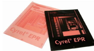
Cyrel® EASY EPR Solvente con Superficie Lisa