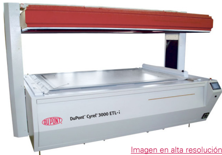
Imagen en alta resolución